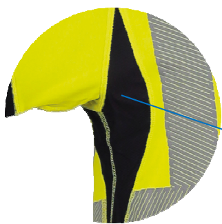
Maille 3D Ultra respirante