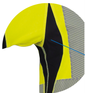
Maille 3D Ultra respirante