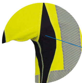
Maille 3D Ultra respirant